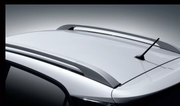
Marco del techo pintado en plata