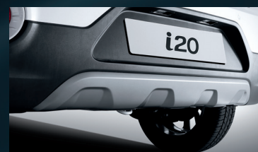
Placa protectora trasera