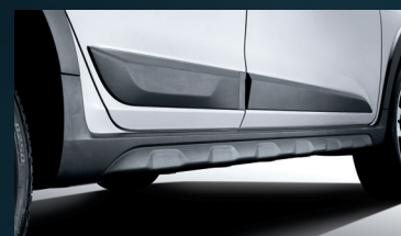
Molduras y revestimientos laterales