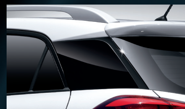
Exterior con detalles en negro piano