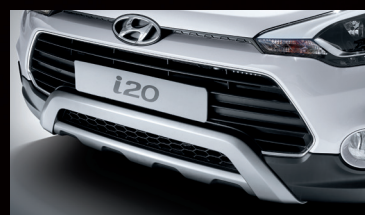
Placa protectora delantera