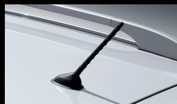
Antena de techo