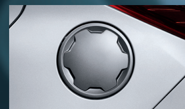
Tapa del tanque pintada en plata