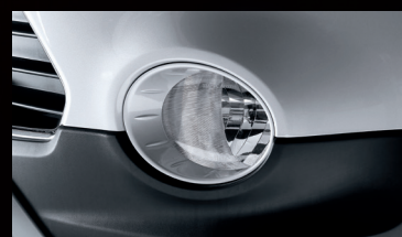
Luces para niebla