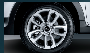
Llantas de aleación de aluminio